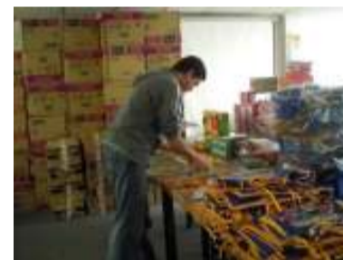
ASOQUIM se sumó a la convocatoria y sus profesionales colaboraron activamente durante el mes de diciembre, para atender la emergencia con los damnificados, así como llevar un obsequio a niños de los refugios, a través de entes oficiales.

Nuestra Asociación también se hizo presente en programas de asistencia a los damnificados. En una campaña conjunta con la Cámara Venezolana de Juguetes, Deportes y Recreación, participó en las jornadas de recolección de ropa, calzado y juguetes para las personas atendidas en los refugios. Durante varios días se cumplió la tarea y se alcanzaron las metas establecidas...! Gracias a quienes colaboraron en esta cruzada de solidaridad.