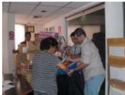
La entrega de juguetes y artículos diversos, también fue coordinada por Asoquím y CAVEFAJ.