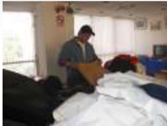
Hijos y sobrinos, sumados a la tarea