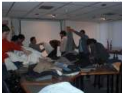
Personal de Asoquím, voluntarios y gente CAVEFAJ en plena faena con la ropa