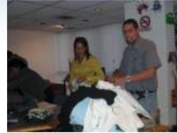
Asesores y consultores en materia legal y tributaria se sumaron a la gestión por los damnificados.