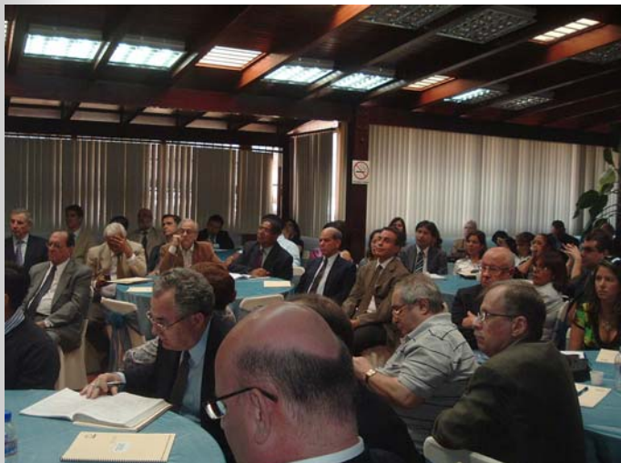
Asistentes a la reunión de la Asamblea Anual de ASOQUIM correspondiente a 2010